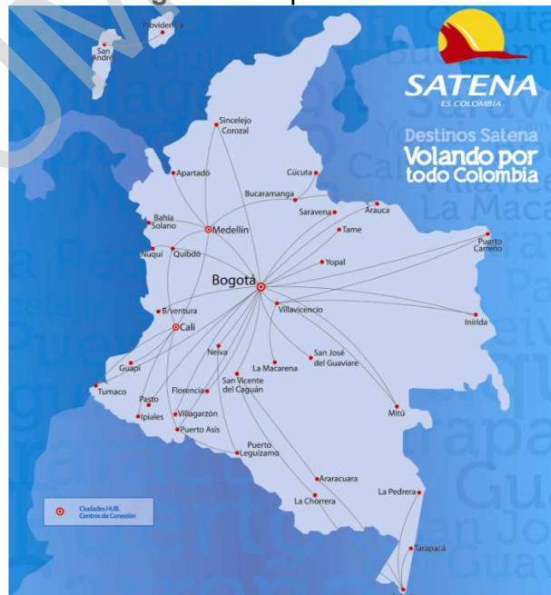
Figura 4. Mapa de Rutas

SATENA presta sus servicios a 41 destinos en 21 departamentos con más de 100 vuelos diarios, cubriendo un 65,6% del territorio nacional con un promedio de 2.500 pasajeros transportados al día, de los cuales el 74% corresponde a rutas sociales y el 26% a rutas comerciales.